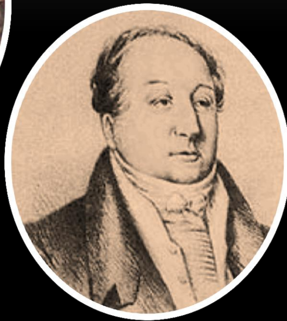
Пушкин В. Л. (дядя Пушкина)